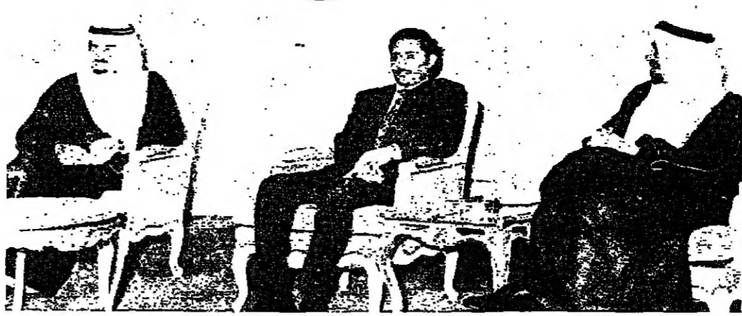
الملك خالد والأمير فهد ورئيس وزراء اليمن عبد العزيز عبد الغني

المساعدة على جعل اليمن حليفا قويا... الكويت - ا.س.م